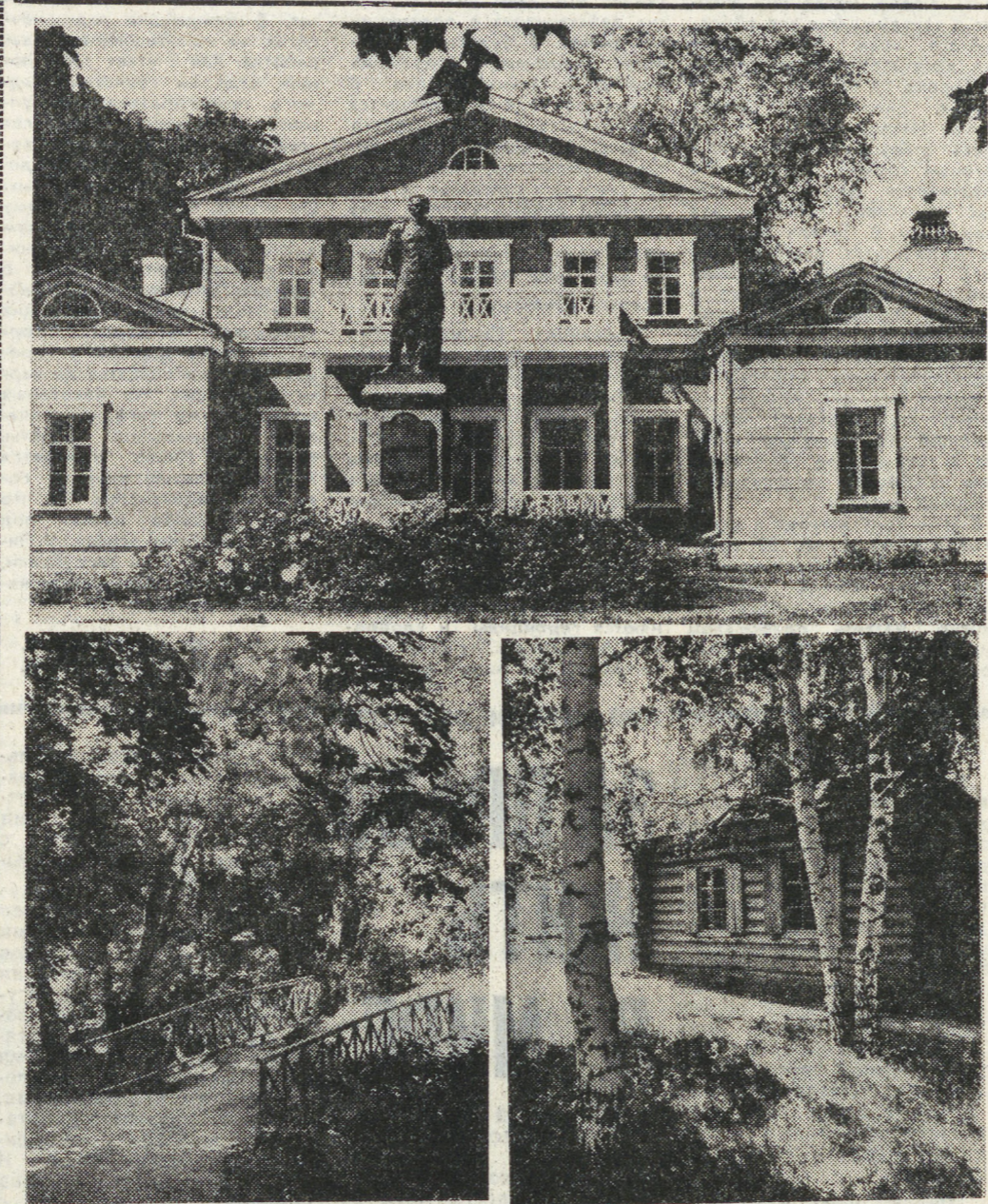
Лермонтовские Тарханы. Они прошли через всю жизнь поэта. Многие лирические образы, картины родной природы навеяны воспоминаниями и впечатлениями ранней юности, днями, проведенными в Тарханах.