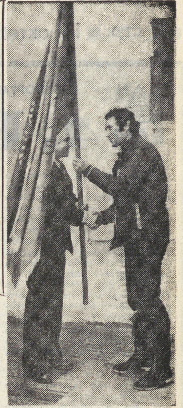
♦ ВСЕСОЮЗНАЯ ЭСТАФЕТА УДАРНЫХ КОМСОМОЛЬСКИХ СТРОЕК

ГАЗЕТА ОСНОВАНА 18 ИЮНЯ 1920 ГОДА № 197 (11336) ВТОРНИК, 14 ОКТЯБРЯ 1980 г. Выходит ежедневно, кроме воскресенья и понедельника. Цена 2 коп.