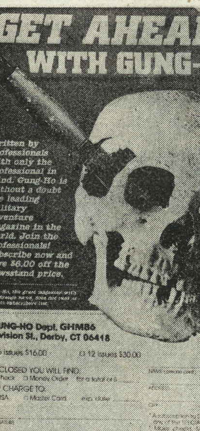
НА СНИМКЕ: реклама на подшивку американского журнала для профессиональных террористов и наемников «Ганг-хо»

35 тысяч семей — представляющих собой своеобразный «срезу» американского общества. Одновременно регистрируются, какие рекламные ролики пользуются в этих семьях популярностью. «Эти новейшие коммерческие банки данных», — подчеркивает газета «Кристен сайенс монитор», — можно с равным успехом использовать для продажи как товаров, так и кандидатов на выборах». Сотрудник мощного исследовательского центра «Эс-Ар-Ай» интронизован Брук Уоррик специалист по проведению рекламных кампаний, нацеленных на определенные слои населения. «Можете быть уверены», — говорит он, — что на президентских выборах 1984 года ко мне обращались все основные кандидаты». В то же время факты свидетельствуют, что превращение американской политической жизни в подобие гигантского телешоу ведет к апатии избирателей. Телевидение, пишет нью-йоркский специалист, «создает у миллионов людей впечатление, будто они, не участвуя в политической жизни, а просто наблюдая за ходом политических кампаний по телевизору, могут влиять на правительственные и политические дела в стране». Сотрудник центра по изучению американских избирателей в Вашингтоне Куртис Ганс выявил общую закономерность: чем сильнее накал телевизионной предвыборной борьбы, тем меньше активность проявляют избиратели.