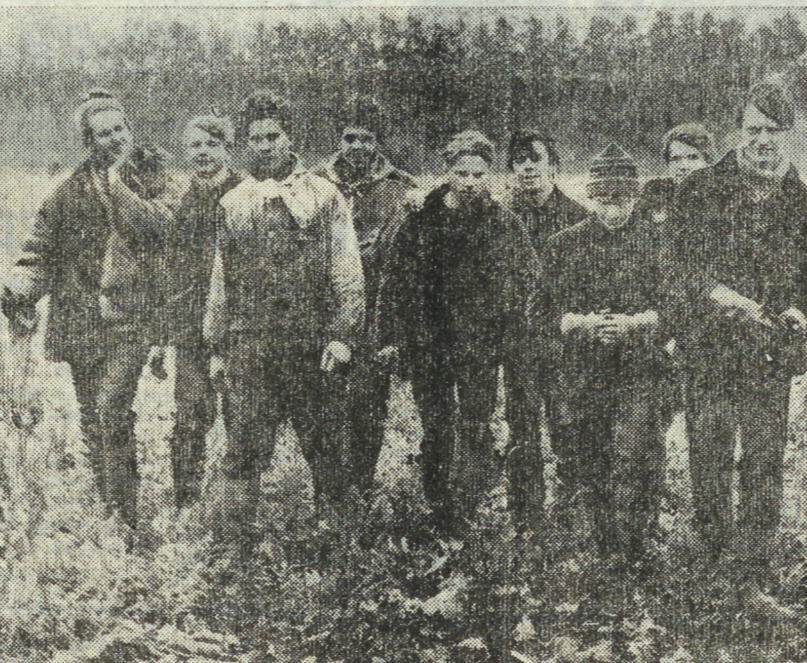
А. ЛАПТЕВ.