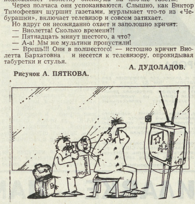
РИСУНОК А. ПЯТКОВА.