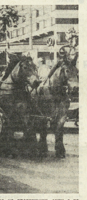
ГДР. Праздничное шествие, посвященное 750-летию Берлина, состоялось в столице ГДР в грандиозном театрализованном представлении почти 40 тысяч профессиональных и самодельных артистов разыграли сцены, воссоздающие различные этапы исторического развития Берлина на протяжении семи с половиной столетий.