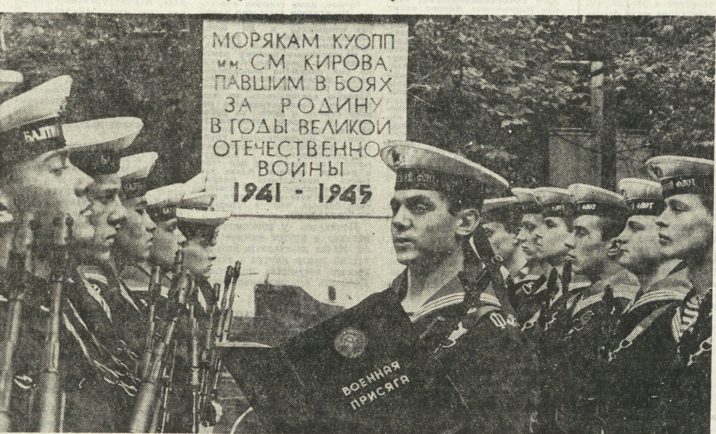
ЛЕНИНГРАД. В качию празднования Дня Военно-Морского Флота СССР и памятки воспитанникам Краснознаменного учебного отряда подводного плавания имени С. М. Кирова, погибшим в боях Великой Отечественной войны, торжественно прозвучали слова военной присяги. На верность

Т. АЗЕРНИЙ, инспектор УВД Свердловской области.