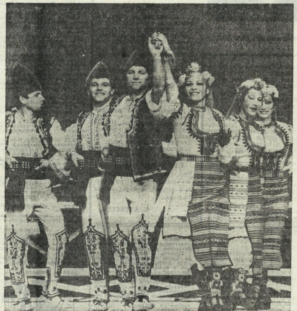
БОЛГАРИЯ. Государственный ансамбль песни и танца «Пирин» более тридцати лет. За это время творческий коллектив дал тысячи концертов в странах пяти континентов. Миллионы зрителей дружно аплодировали самобытному искусству. Секрет успеха артистов — в верности народным традициям, высоким мастерством исполнителей, тематическом многообразии репертуара.