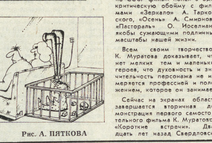
рис. А. ПЯТКОВА

«НА СМЕНИ!» ИНДЕКС 53800 Входит ежедневно кроме воскресенья и помеченных. По вопросам подписки и доставки обращаться в отделении связи агентства «Союзпечать». 620219 СВЕРДЛОВСК, ГСП 153, ул. ТУРГЕНЕВА, 13, 12-Й ЭТАЖ, РЕДАКЦИЯ ГАЗЕТЫ «НА СМЕНИ!»