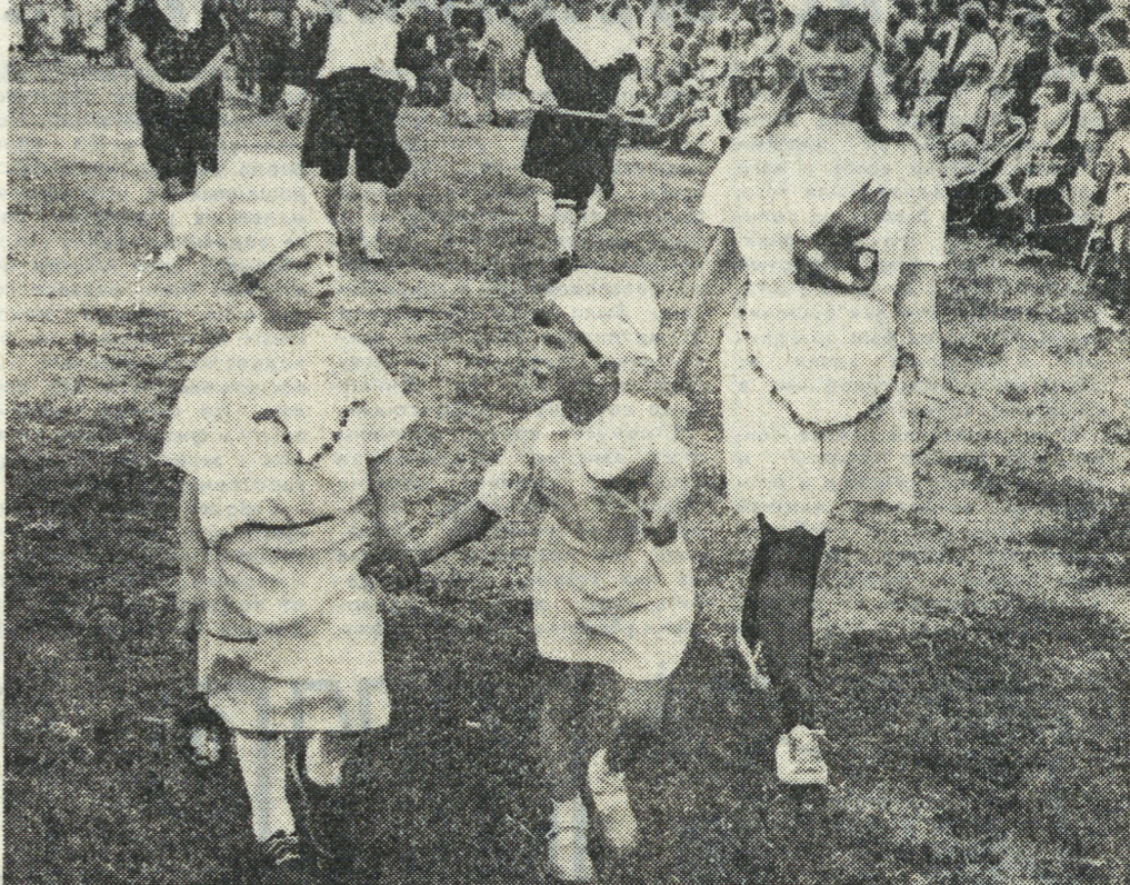
НА СНИМКЕ: участники карнавала. Тон толстая и веселые повара.