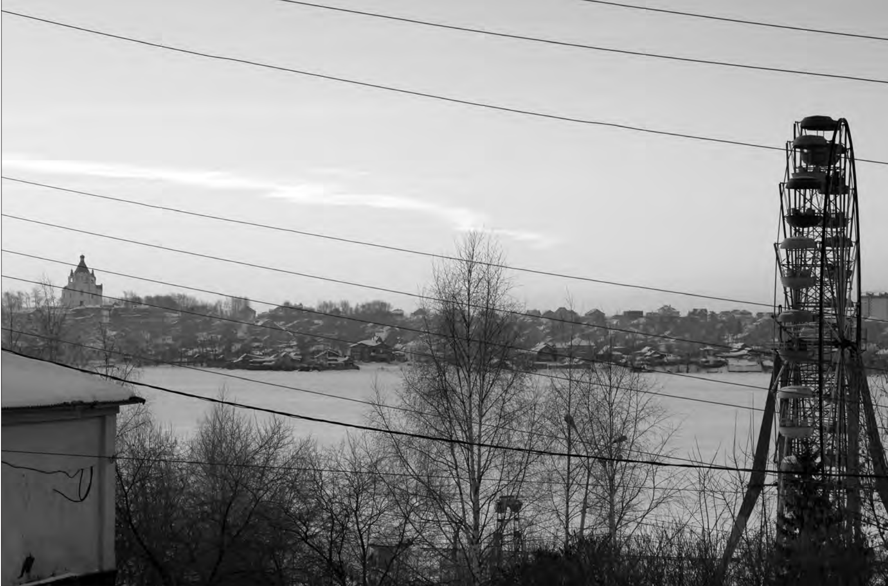
След от метеорита был хорошо виден над Тагильским прудом.

Спустя полчаса после визита неопознанного объекта в небе появились три реактивных истребителя, которые отправлялись как раз по траектории следования