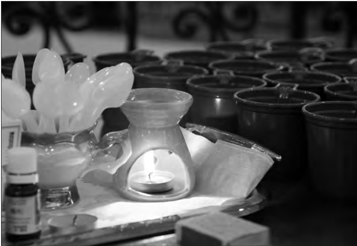
Аромалампа с эвкалиптом.

На стендах «Лесной аптеки» представлены десятки фотографий лекарственных растений нашего края и странички из музейного гербария. Здесь же даны пояснения, какие травы могут помочь при заболеваниях желудочно-кишечного тракта или сердечно-сосудистых проблемах, а какие рекомендуются при сухом кашле. Кроме того, посетители выставки обязательно знакомятся с правилами сбора, хранения и использования растительного лечебного сырья и настоя-