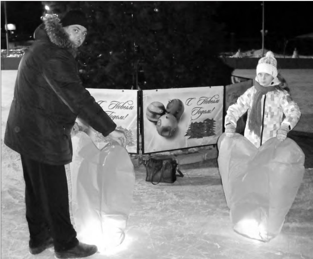
Так выглядели небесные фонарики на земле.

Судя по всему, мероприятие очень понравилось молодежи. Уже вечером в социальных сетях и на некоторых городских форумах появились призывы провести своеобразные флешмобы, массовые общегородские запуски небесных фонариков, такие же, как в популярном мультфильме «Рапунцель»: там весь город вышел на улицу, и каждый житель запустил по небесному фонарику. Если организаторам флешмоба удастся собрать народ на общее дело, зрелище наверняка будет грандиозным.