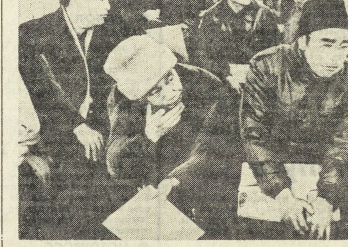
Многие участники антивоенных маршей много членов профсоюзов.

Несколько лет назад Австралийский совет профсоюзов провозгласил борьбу за мир делом рабочих. Их участие в антивоенном марше показывает, что призывы действуют. В какой-то мере это можно также считать и отчетом о повседневной работе членов профсоюзов. Многие