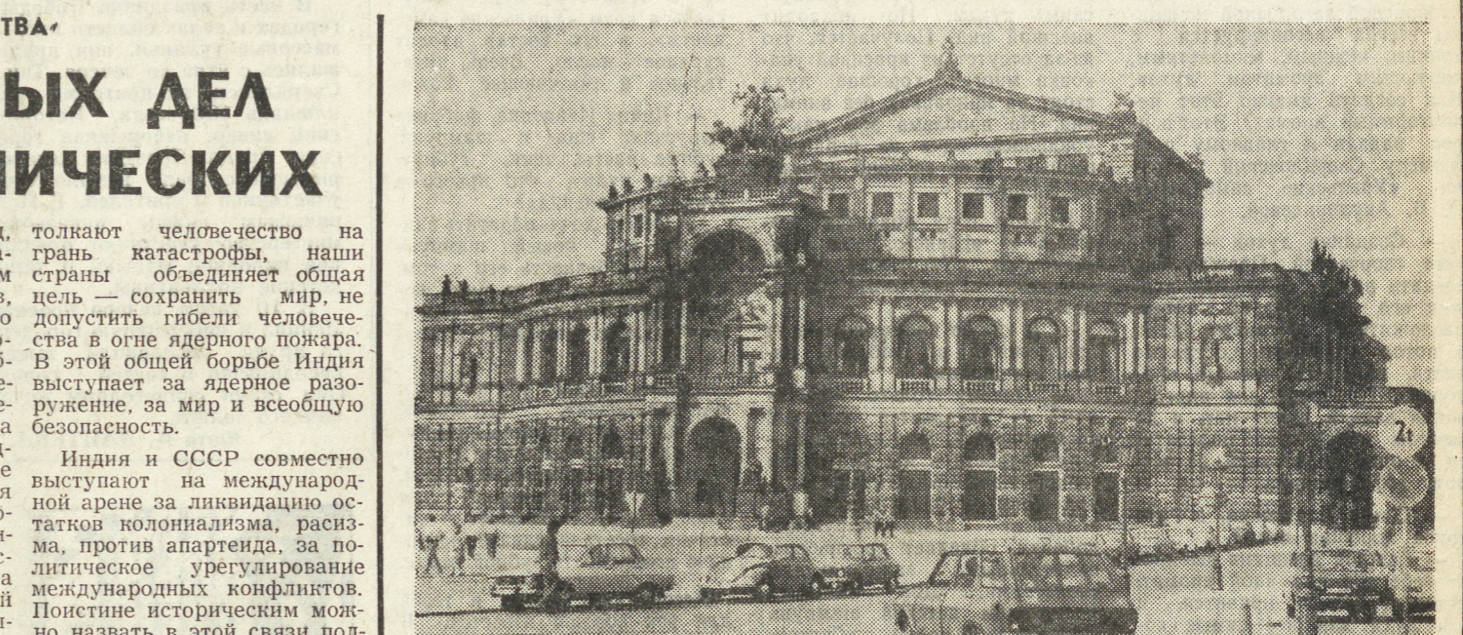
Дрезден. Здание оперного театра — творение немецкого зодчего Готфрида Земпера.