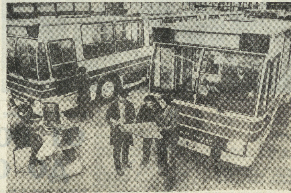
БОЛГАРИЯ. Коллектив автокомбината «Чавдар» в Бетевграде освоил производство двух новых типов троллейбусов повышенной вместимости, оснащенных специальным регулятором напряжения. Он позволяет экономить около 40 процентов энергии. НА СНИМКЕ: в цехе завода «Чавдар», где монтируются троллейбусы.