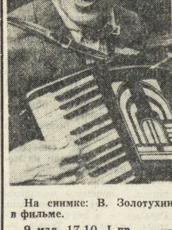
На снимке: В. Золотухин в фильме.