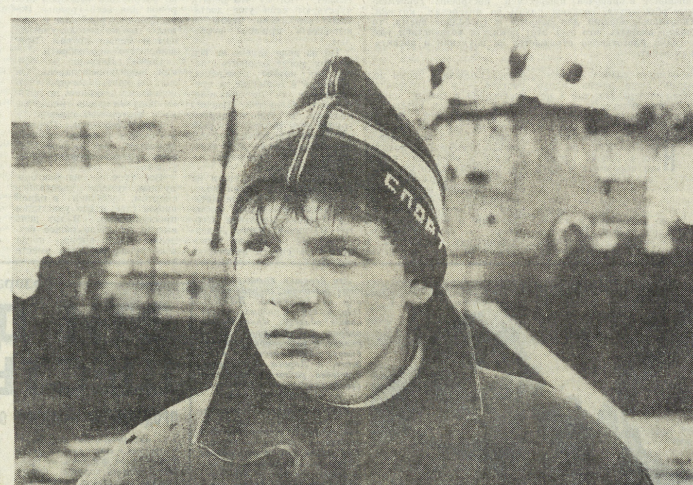
Восна вошла в свои права: в городах почти стоял снег, освобождаются от льда реки. Приближается начало навигации у речников Свердловского районного управления Обь-Иртышского речного пароходства. К 1 мая наметили они привести первый плот древесины в город Тавду. На судах и в мастерских сейчас кипит работа: проверяется исправность механизмов, регулируются двигатели, белят борта и палубы свежей краской. Управление трудится с опережением графика.