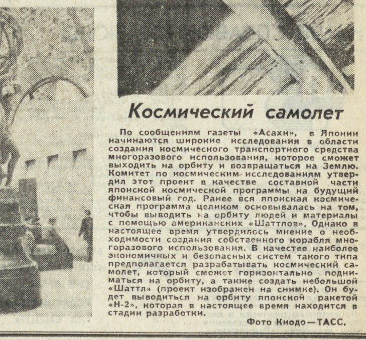
Космический самолет. По сообщению газеты «Асахи», в Японии начата широкая программа исследования в области создания космического транспортного средства многоуровневого использования, которое сможет выводить на орбиту и возвращаться на Землю. Комитет по космическим исследованиям утверждает этот проект в качестве составной части японской космической программы на будущий финансовый год. Ранее вся японская космическая программа целиком основывалась на том, чтобы выводить на орбиту людей и материалы с помощью американских «Шаттлов». Однако в настоящее время утвердилось мнение о необходимости создания собственного корабля многоуровневого использования. В качестве наиболее экономичных и безопасных систем такого типа предлагается разработать космический самолет, который сможет горизонтально подниматься на орбиту, а также создать небольшой «Шаттл» (проект изображен на снимке). Он будет выводится на орбиту японской ракетой «Н-2», которая в настоящее время находится в стадии разработки.

Все большую популярность приобретает открывшийся недавно в Париже крупнейший в стране музей Орсе (на снимке). В его залах демонстрируются работы мастеров второй половины XIX — начала XX века, прежде всего шедевры художников-импрессионистов. Всего здесь собрано свыше 2,3 тысяч картин, почти тысячи скульптур, 13 тысяч фотографий, рисунков, эскизов, более тысячи предметов декоративно-прикладного искусства. Музей разместился в здании бывшего вокзала Орсе, построенного на набережной Сены в конце прошлого века.