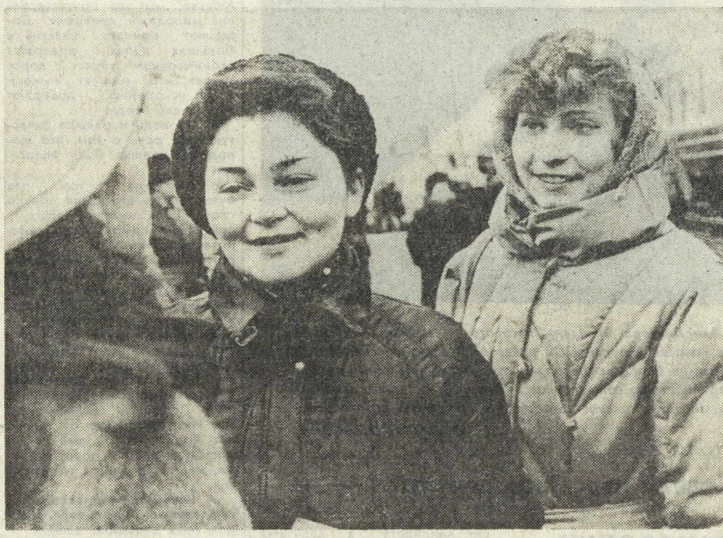
Будет ли на заводе МЖК?

Жилые ребятам понравился. Большой детский комбинат, культурно-спортивный комплекс, хозяйственный блок с мастерскими и складами, кафетерий, пункт проката, химчистка, прачечная, парикмахерская, зал семейных вечеров, пункт приема заявок на все виды услуг. Чт и говорить, предусмотрено все. Хоть сейчас выезжай. Но как раз этого сделать и нельзя. Все, что было сейчас перечислено, всего лишь проект. Проект молодежного жилого комплекса производственного объединения «Уральганзавод». Есть, правда, уже макет. Вокруг него-то и собирались группами молодые вагоностроители, пришедшие в заводской Дворец культуры на первую организационно-выборочную конференцию МЖК. Причины, побудившие их прийти сюда, были у всех разные. Одни хотели просто разуть все до мелочей, другие горели желанием поскорее взяться за дело. И расхождение такое было не случайно. В январе в одном из микрорайонов Нижнего Тагда с красивым названием