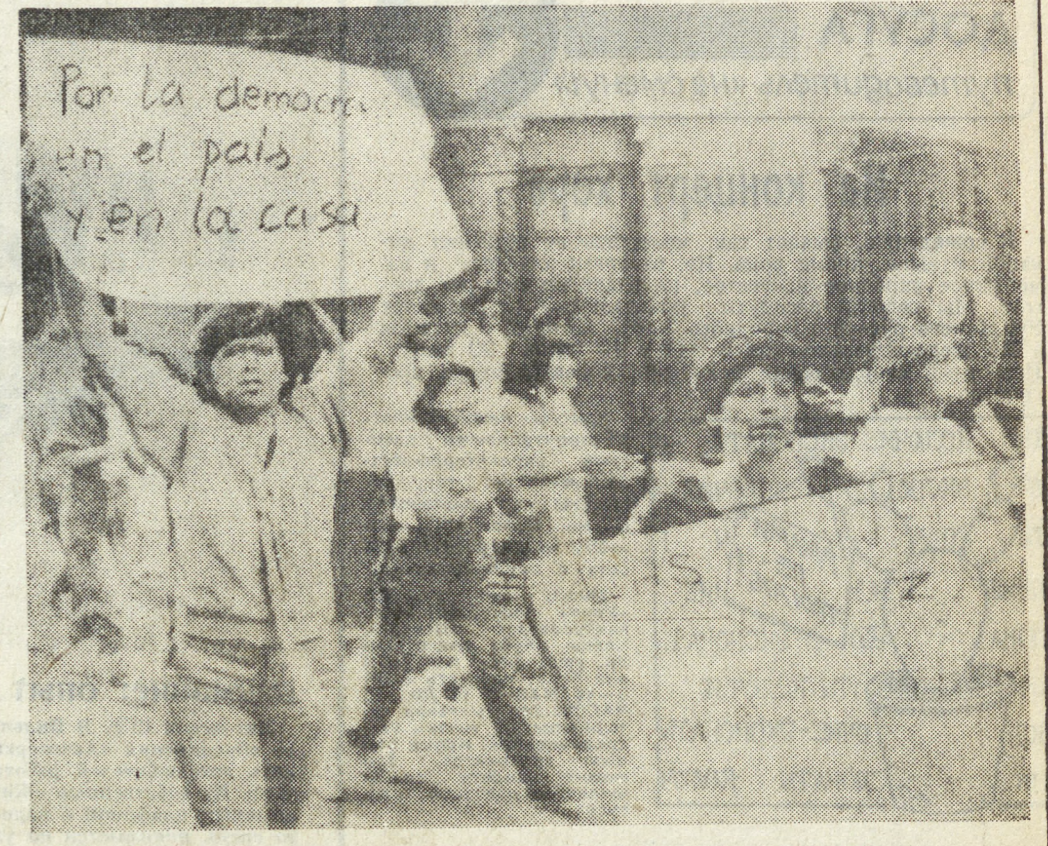
ЧИЛИ. Прогрессивные силы страны продолжают борьбу с неконституционным режимом Пиночета. В Сантьяго состоялась манифестация протеста, участники которой потребовали прекращения террора, отставки диктатора, демократизации жизни в стране. НА СНИМКЕ: участники манифестации в Сантьяго.