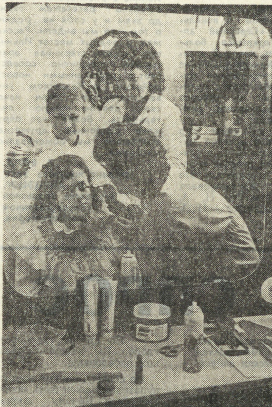
портрет на фоне любви