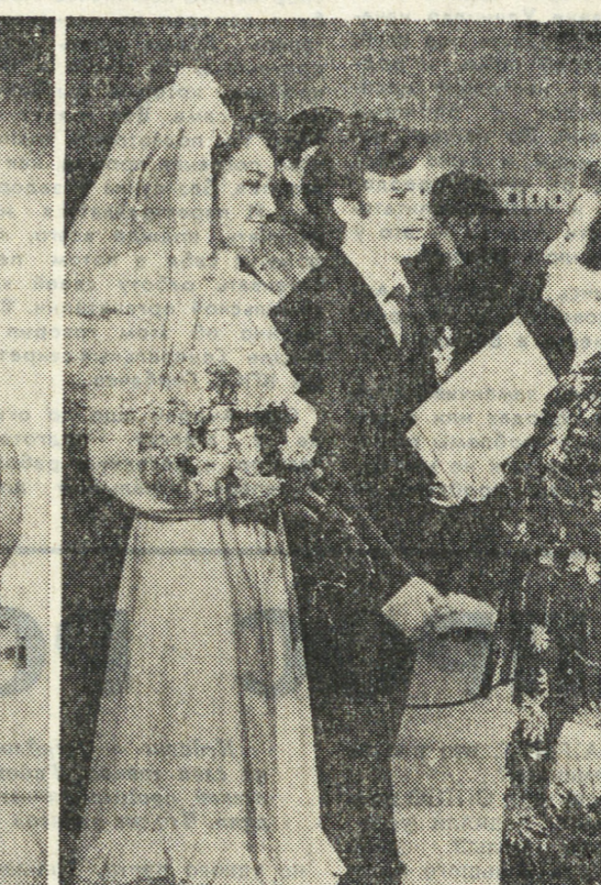
портрет на фоне любви