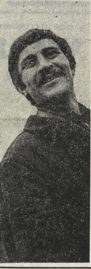
«Союз должен быть таким, чтобы любой рабочий видел бы в нем людей...»

◆ СОВХОЗ «БОРОДУЛИНСКИЙ» ВКЛАД МОЛОДЫХ ХЛЕБОРОБОВ В УРОЖАЙ-80 ◆ СТУДЕНТЫ - ПЕРВОКУРСНИКИ УРАЛЬСКОГО ПОЛИТЕХНИЧЕСКОГО ИНСТИТУТА ХОРОШО ПОМОГАЮТ СЕЛЯНАМ В УБОРКЕ ОВОЩЕЙ