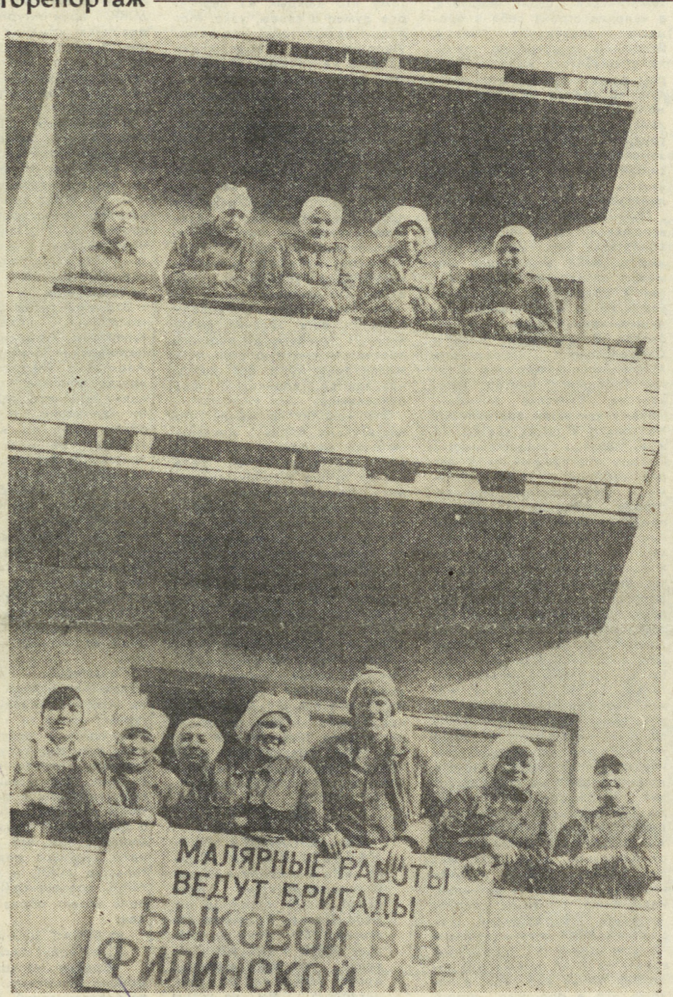
МАЛЯРНЫЕ РАБОТЫ ВЕДУТ БРИГАДЫ БЫКОВОЙ И ФИЛИНКОЙ.