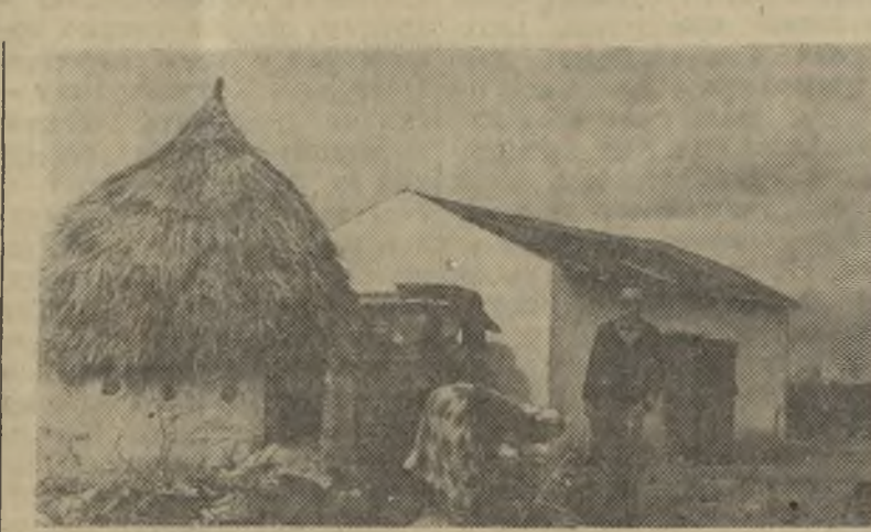
Марокко. Жилище марокканского крестьянина в окрестностях Рабата.