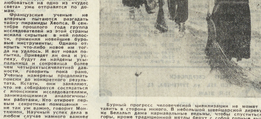
Бурный прогресс человеческой цивилизации не может оставить в стороне никого. В небольшой швейцарской деревушке Беллы даже карнаваловые ведьмы, чтобы спуститься в горы, кроме традиционной метлы берут с собой горные лыжи.

Пятисуток кошку обнаружил за контейнерами во дворе управляющего завода. Он поднял тревогу, вызвал полицию и пожарных, но зверя и след пропал. Леопард доказал, что не зря считается ловким и хитрым зверем. Двое суток искал нарушителя, но безуспешно. Пытались было привлечь сторожевую собаку, но она оказалась «психологически не подготовленной» и, едва почувя хищника, поджала хвост. Наконец, один из рабочих услышал рев голодного зверя из небольшого помещения и захлопнул дверь. Прибывший специалист дельхайского зоопарка обнаружил леопарда усыпавшей пудой.