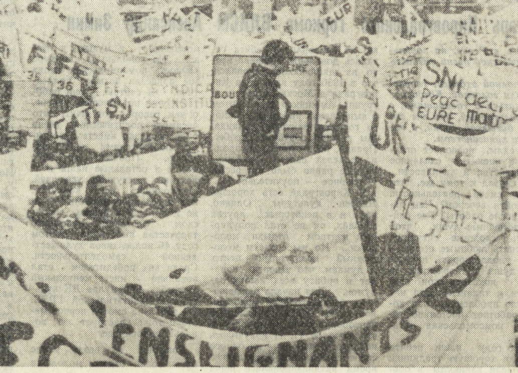
ТАМ, ГДЕ ПРАВИТ КАПИТАЛ