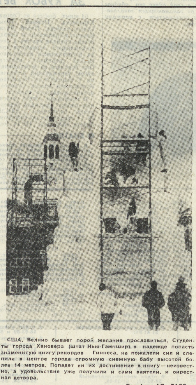
США. Велико бывает порой желание прославиться. Студенты города Хановера (штат Нью-Гэмпшир), в надежде попасть знаменитую нигу рекордов Гиннеса, не пожалели сил и слез: в центре города огромную снежную бабу высотой более 14 метров. Попадет ли их достижение в книгу — неизвестно, а удовольствие уже получили и сами ребята, и окрестная детвора.

ГАВАНА. На канон по рекам бассейна Амазонки в Карибском море — под таким девизом 2 марта начнется международная научная экспедиция, организованная под эгидой ЮНЕСКО. Ее цель — доказать, что в древности южноамериканские индейцы совершили плавание по притокам крупнейших рек Латинской Америки Амазонки и Ориноко на острове Карибского моря. (ТАСС.)