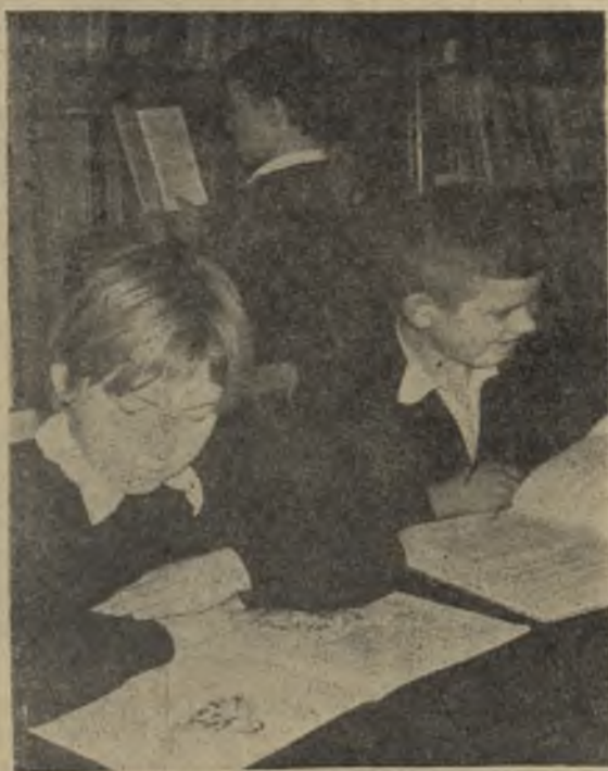
В читальном зале городской детской библиотеки.