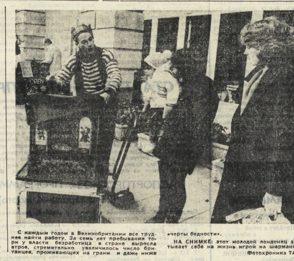
С каждым годом в Великобритании все труднее найти работу. За семь лет пребывания в эмиграции в стране выросла безработица, стремительно увеличилось число британцев, проживающих на грани и даже ниже черты бедности.

НА СНИМКЕ: этот молодой лондонец зарабатывает себе на жизнь игрой на шарманке.