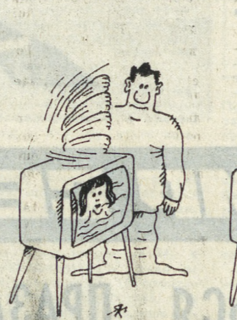
Рис. С. ЯКОВЛЕВА и Ю. САННИКОВА.