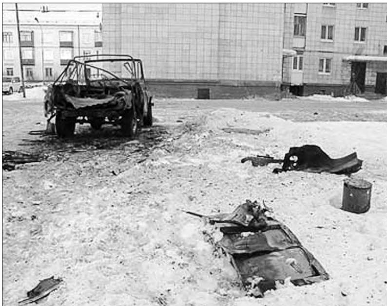
Части взорвавшегося УАЗа раскидало на десятки метров вокруг.

Сообщение о возгорании автомашины УАЗ, стоящей у дома №40 по проспекту Вагоностроителей, поступило в дежурную часть ММУ МВД России «Нижнетагильской» в половине второго ночи 13 февраля.