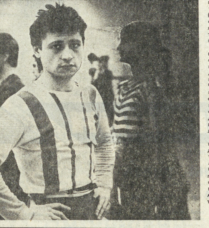
О. ПЕТРОВ.