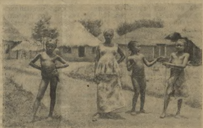
Либерия. В деревне недалеко от столицы страны города Монровия.

Закончившийся первый этап подведения итогов в 109 кооперативах области Сольнок свидетельствует о том, что их доходы в 1961 году превосходят уровень предшествующего года на 180 миллионов форинтов.