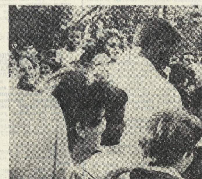
КАРАКАС. Около миллиона детей в возрасте до пяти лет ежегодно умирает в странах Латинской Америки и Карибского бассейна от голода и болезней, средства борьбы с которыми давно уже найдены современной медициной.

ВАШИНГТОН. Многие американские школьники демонстрируют острое неведение в вопросах географии и политики. К такому неутешительному для себя выводу пришли авторы доклада, подготовленного по инициативе ассоциации губернаторов южных штатов США.