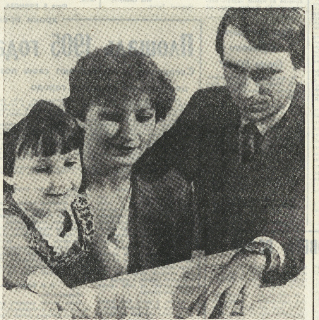
моя Родина — СССР