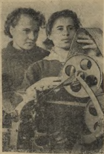
Псковская область. Коллектив Великолукской швейнотрикотажной фабрики досрочно выполнил план 1961 года.

Общественные исследователи организовали опытный пробег одной из установок каталитического крекинга и сумели проверить действенность своего предложения об увеличении производства попутного химического продукта — бутилена, необходимого для выра-