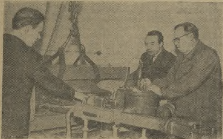
Томск. В Научно-исследовательском институте ядерной физики, электроники и автоматики при Томском политехническом институте пущен первый в Сибири микротрон — ускоритель для получения электронов с энергией до 5 миллионов электронов вольт.