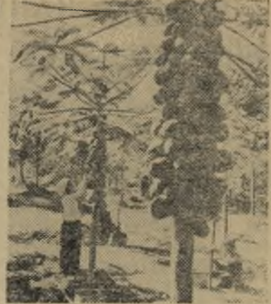
Китайская Народная Республика. На плантации папайи (дынное дерево) в провинции Юньнань.

Сессия приняла развернутое постановление, направленное на улучшение работы исполкома райсовета в 1962 году.