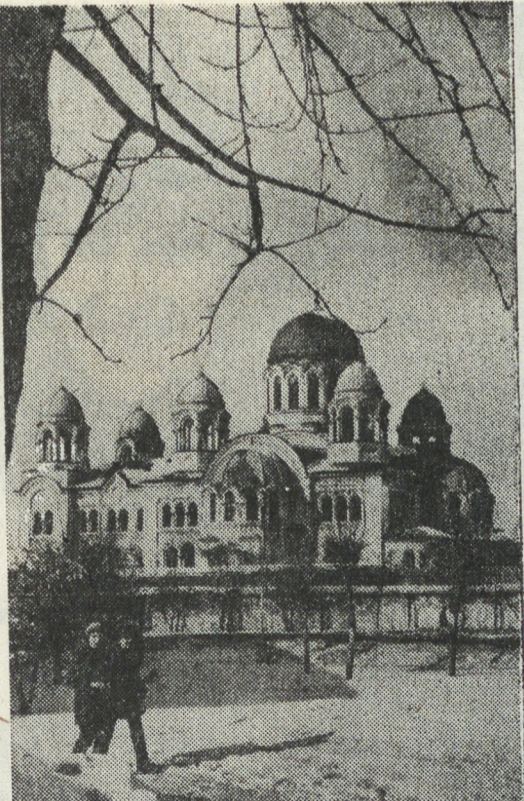
НА СНИМКАХ: «дышавшие старинной глубиной», Крестовоздвиженский собор. Внешне он напоминает соборы Исакия, хотя нельзя назвать это творение рук человеческих только «слепой» копией. Ведь искиские зодчие вложили в него частичку своей души. И в этом секрет неповторимости: на повестке дня — будущее Верхотурья. Занятие в школе комсомольского актива

«На семинаре присутствовал второй секретарь посольства МНР в СССР Лхамсурэн.