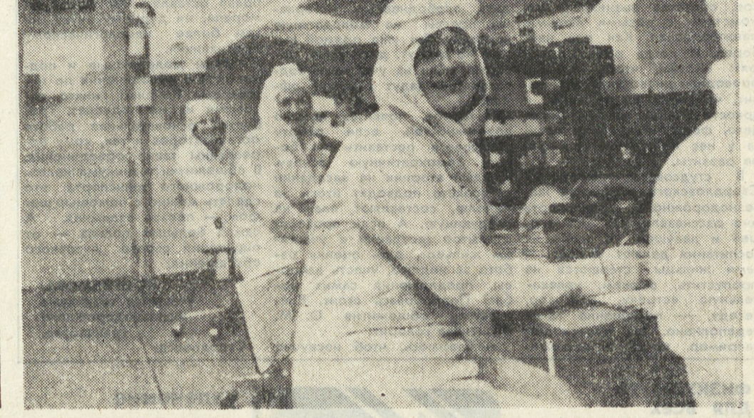
Исполнители детского театра из города Олбани (штат Нью-Йорк).