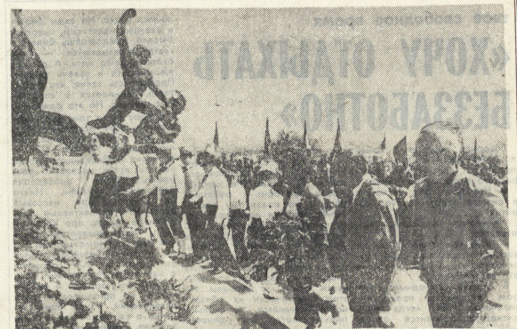
4 АПРЕЛЯ — ДЕНЬ ОСВОБОЖДЕНИЯ ВЕНГРИИ ОТ ФАШИЗМА

«По моему, — говорит Евтушенко, — американские издатели во многом вынуждены перед советской литературой. И у нас, конечно, тоже есть «большие пятна» на географической карте весьма разнообразной американской литературы, но все-таки наши читатели благодарны, в частности, знаменитому изданию книг знаменитых американцев — среднему американцу — советский народ... Угроза войны тем более опасна, что люди, которые держат па-