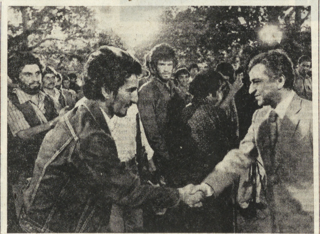
В Кабуле состоялась встреча Генерального секретаря ЦК КПД, Председателя Революционного совета и премьер-министра ДРА Бабрака Кармала со студенческим отрядом Защиты революции (на снимке). Этот отряд в течение трех с половиной месяцев находился в провинции Лагман, где оказывал помощь местным властям в борьбе с бандами террористов и диверсантов. В составе отряда, насчитывающего 60 человек, в основном были студенты Кабульского политехнического института и столичного университета. За это время по горным тропам, преодолевая банды наемников, забрасываемых в Афганистан из-за рубежа. Отряд с честью выполнял поставленную перед ним задачу. После суровой боевой жизни добровольческий отряд студентов возвратился в Кабул продолжать учебу.