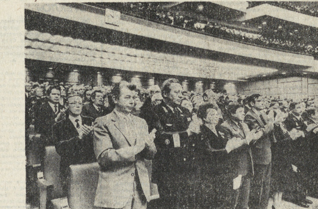
МОСКВА. Кремлевский Дворец съездов. XXVII съезд КПСС.