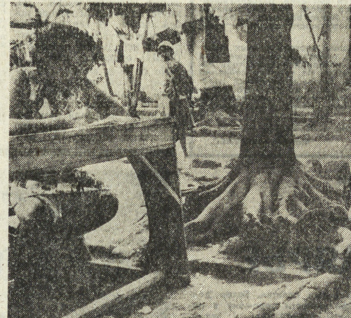
Согласно данным Экономической комиссии ООН для Латинской Америки (ЭКЛА), 68 процентов сальвадорцев живут в нищете, в то время как богатая прослойка, составляющая лишь 20 процентов населения страны, присваивает 66 процентов национального дохода. В минувшем году инфляция в Сальвадоре достигла 27,4 процента. Огромные расходы на содержание репрессивного аппарата, коррупция в правящей верхушке в сочетании с действующей системой распределения национального дохода в пользу богатых ведут экономику режима к неминуемому краху. По утверждению специалистов, лишь все увеличивающийся поток долларов, направляемый в страну Соединенными Штатами, позволяет Дуарте сводить концы с концами.

мать логику гонки вооружений. Наконец, советские инициативы представляют собой новый, заслуживающий внимания подход к международным отношениям, особо подчеркивая ответственность каждого государства, большого или малого, богатого или бедного, в деле сохранения мира.