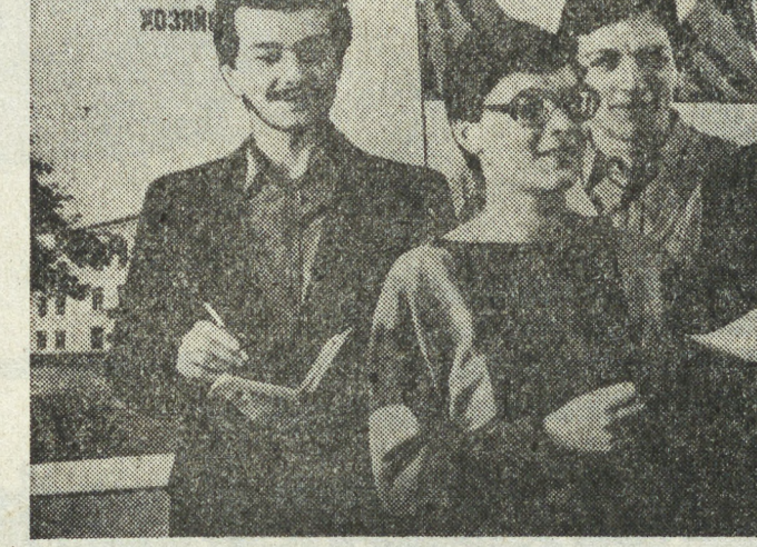
ИССЛЕДОВАТЕЛЬСКИЙ ИНСТИТУТ СЕЛЬСКОГО ХОЗЯЙСТВА

О. Сродных: — Конференция убедила нас, что совет молодых ученых замыкается на решении довольно узких вопросов. Появилась идея: для увеличения внедрения разработок создать на базе совхоза молодых ученых инициативную группу, подклю-