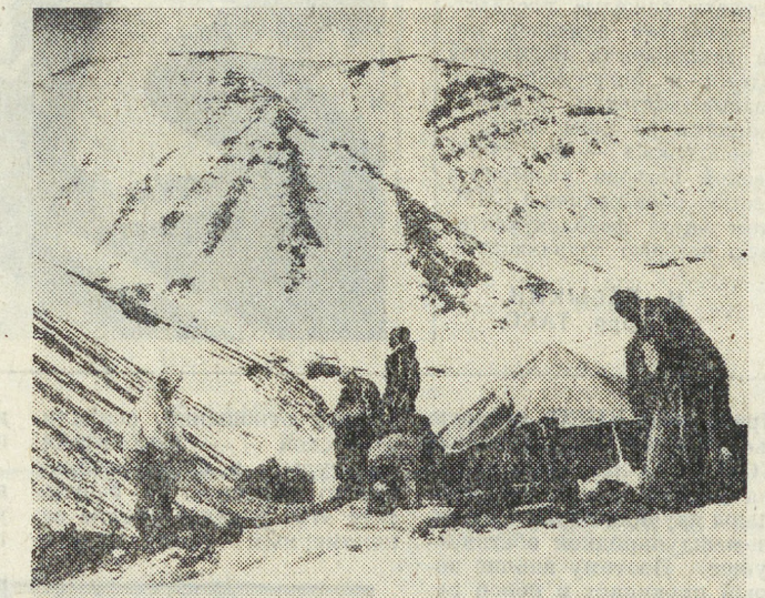
ветви стланки, словно обещая, невидимый уже в десяти метрах. Мы решили спуститься вниз. Что это: единственно верное, безопасное решение, которым стоит гордиться, или минутная слабость, о которой впоследствии вспомнить потом?

Последняя из пяти наших вершин венчала удивительный горноветвистый район. Мы и не предполагали, что за полными трудноподходимыми как в Джунглях. Берега ручья, ведущего в горы, покрыты дождевой редкой лиственной тайгой, но все пространство между деревьями заполнено мелкой густой растительностью. Мох доходит до колен, чуть выше за ноги цепляется карликовая березка. Пройдись сквозь такие заросли очень трудно. Единственный путь — прямо по руслу ручья.