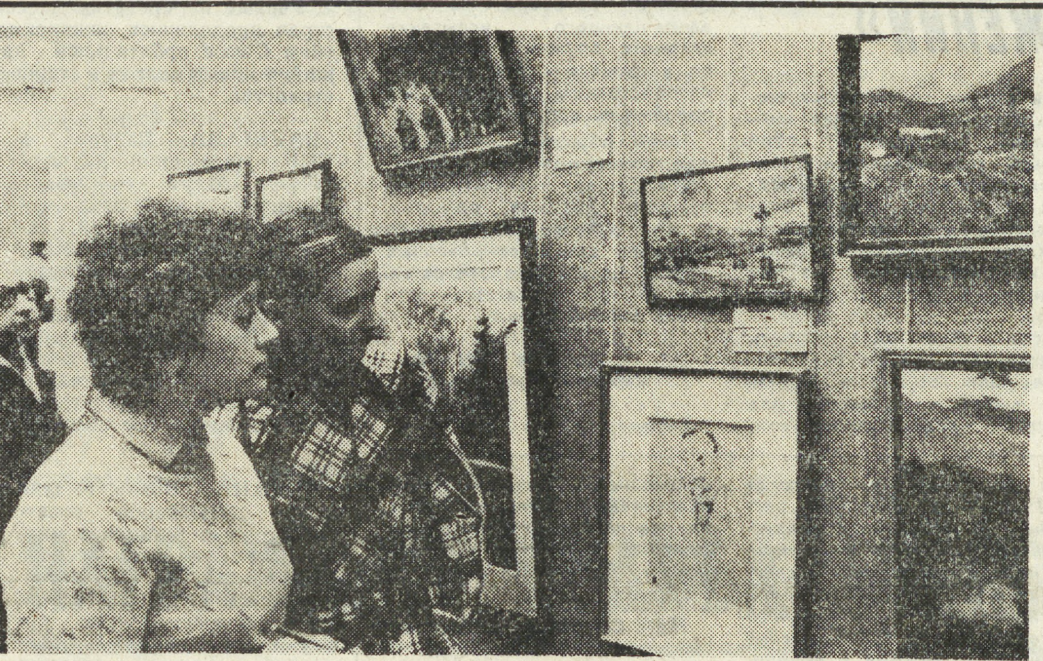
«Русское искусство XVIII—начала XX вв. Из частных собраний Ленинграда» — так называется выставка, развернувшаяся в Центральном выставочном зале города. Она подготовлена работниками зала и сотрудниками Ленинградского отделения Всероссийского общества охраны памятников истории и культуры.

ПОГОДА 27-28 февраля по области ожидается облачная погода с прояснениями. 27 февраля — снег, снег, снег. 28 февраля — снег, снег, снег. Ветер южный с переходом на западный. 27-28 февраля в Свердловске температура воздуха ночью 27 февраля 11-16, 28 февраля 17-22. Днем 8-13 градусов мороза.