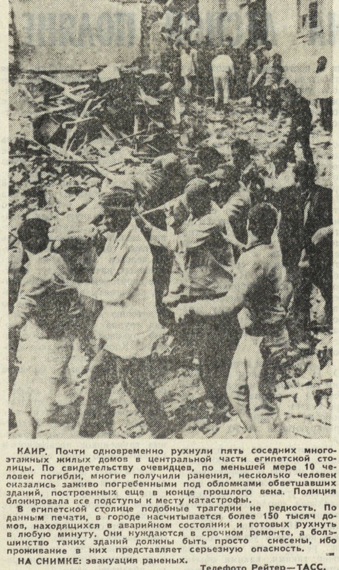
КАИР. Почти одновременно рухнули пять соседних многоэтажных жилых домов в центральной части египетской столицы. По свидетельству очевидцев, по меньшей мере 10 человек погибли, многие получили ранения, несколько человек оказались серьезно погребенными под обломками обветшавших зданий, построенных еще в конце прошлого века. Полиция блокировала все подступы к месту катастрофы. В египетской столице подобные трагедии не редкость. По данным печати, в городе насчитывается более 150 тысяч домов, находящихся в аварийном состоянии и готовых рухнуть в любую минуту. Они нуждаются в срочном ремонте, а большинство таких зданий должны быть просто снесены, ибо проживание в них представляет серьезную опасность. — НА СНИМКЕ: эвакуация раненых.