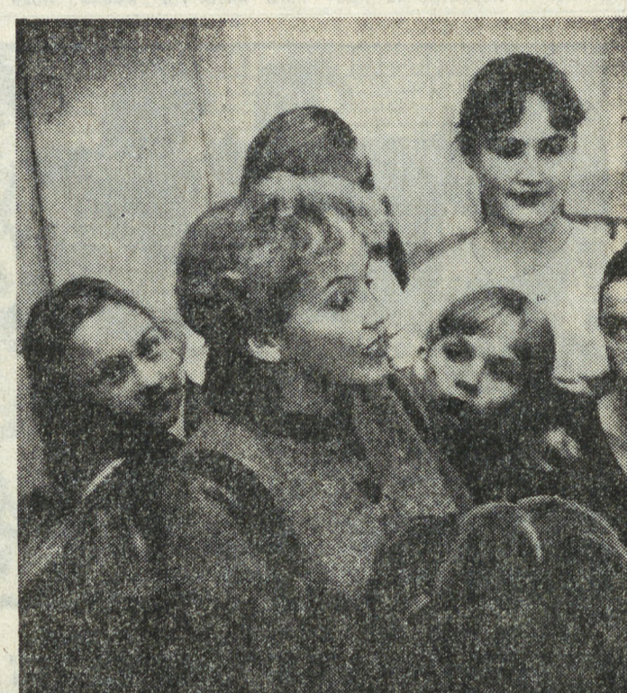
Более пяти лет работает в туринском Доме пионеров танцевальная студия. За это время в студии сменялось не одно поколение ребят. Основное направление деятельности студии — это народные танцы. Ребята во время