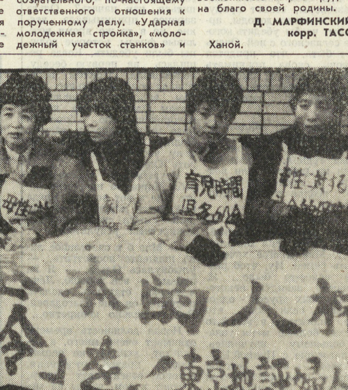
Тротуар перед зданием министерства труда в Токио стал местом проведения нескончаемых демонстраций против существующей позорной практики дискриминации японских женщин на производстве и при найме на работу. Участники манифестаций, большинство из которых — труженницы столичных предприятий и учреждений, требуют от властей увеличить число рабочих мест для женщин, повысить им