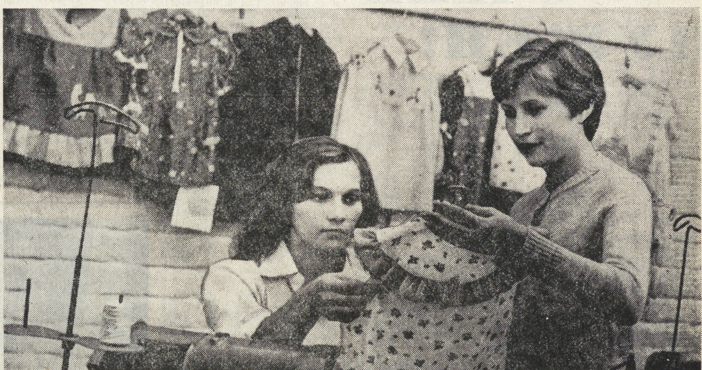
Трудовые успехи посвящает XXVI съезду КПСС швейный цех № 2 фабрики «Октябренок».

МОЛОДЫЕ УЧАСТНИКИ КОРМОЗАГОТОВИТЕЛЬНОЙ КАМПАНИИ В ЗАВЕРШАЮЩИЕ ДНИ ЛЕТНЕЙ СТРАДЫ СТРЕМИТЕСЬ К РЕКОРДНОЙ ВЫРАБОТКЕ! ПУСТЬ КАЖДЫЙ ДЕНЬ СТАНЕТ УДАРНЫМ!