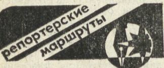
Верхняя Пышма.

3 ВОНОК раздается самый обычный. Медсестра снимает самую обычную телефонную трубку. — Алло! Что у вас? Сколько лет? Подключайте! Зеленая звездочка вспыхивает на осциллографе и бежит, вычерчивая лучом нервные зубцы. Бежит так быстро, что только привычный глаз работнической дистанционной диагностической службы областного кардицентра успевает улавливать отклонения в работе сердца. Живое, страдающее человеческое сердце бьется неровно, просит помощи, и его слышат за десятки, сотни километров. Из Издлера и Красноуральска, Серова и Шаля, Асбеста и Кировграда его удары стучат в телефонной трубке, и чуткий аппарат переводит их на язык электрокардиограммы.