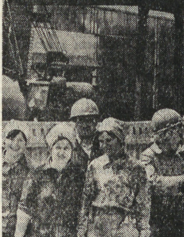
БЕЛОРУССКАЯ ССР. 290 тысяч квадратных метров новых производственных площадей предстает в заводе «Гомельмаш»...