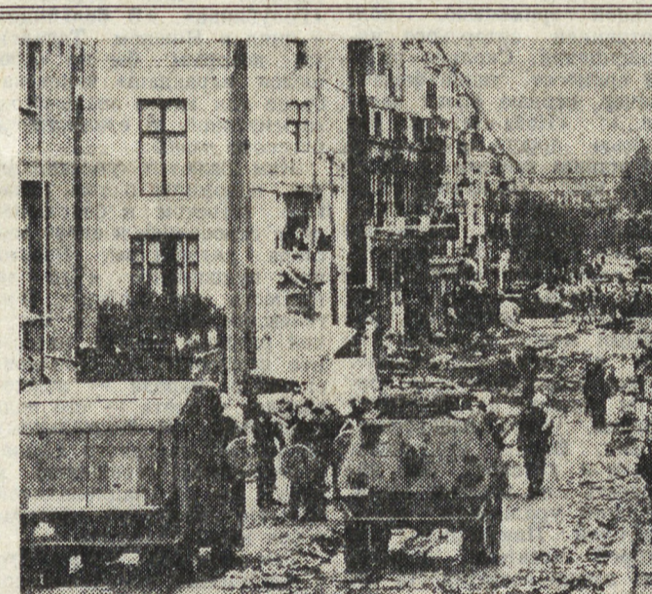
Этот кадр взят не из военной хроники... Так на снимке из западной печати выглядела недавно центральная часть впадины голландской столицы Амстердама...