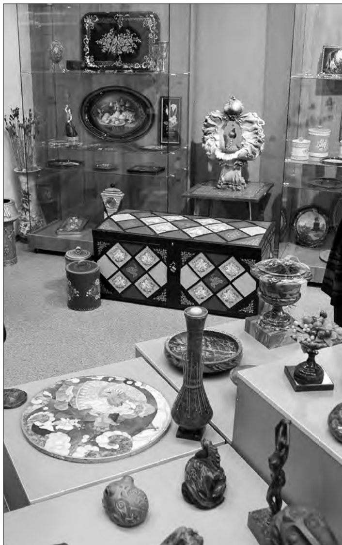
Фрагмент экспозиции в музее колледжа.

частности, тагильской лаковой росписи по металлу, и неоднократно подчеркивал: тагильский поднос является брендом всей Свердловской области, уникальным художественным явлением.