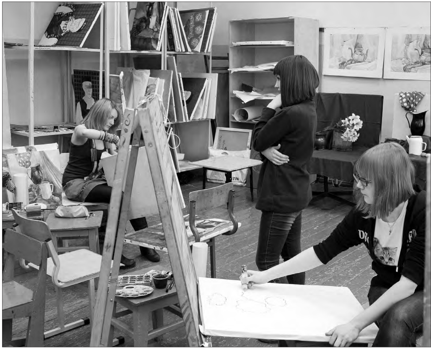
Творческий процесс в одном из учебных классов.

Людмила ПОГОДИНА.