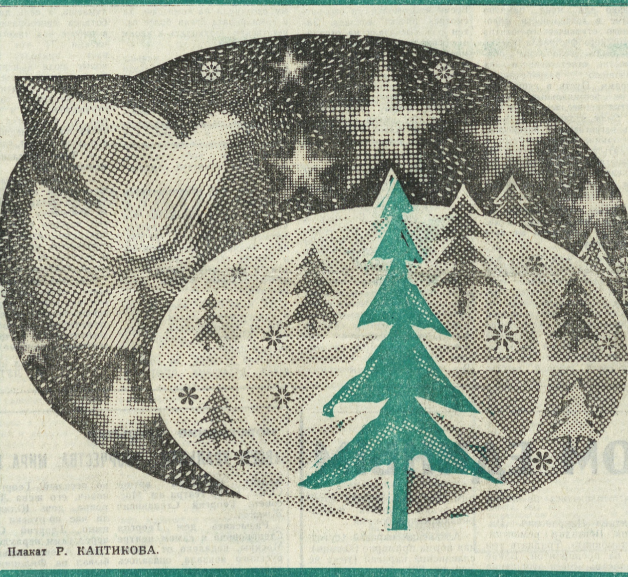
Плакаты Р. КАПТИКОВА.

А путь наш горячей работой расцветен. Отечество! Это — богатство твое. Порукою мира — Женевская встреча советской страны громадьей. Шагаю размышисто, бодро и гордо. Стране новостроек — мечты и любовь. Сердцебиение Нового года Несу вдохновенно в светлую новь!