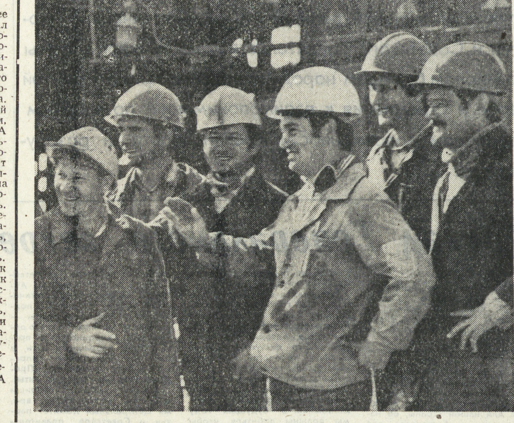
КАЗАХСКАЯ ССР. На проектно-мощность вышло Жанажолыское нефтеносное месторождение производственного объединения «Антобизнес». Непросто создать в полупустынной степи нефтедобывающий комплекс. Жанажол поставил много задач не только перед буровиками, но и перед учениками. Векнами дремлющую степь разбудили машины, буровые установки, уже сдан в эксплуатацию газоперекачивающий завод углеводородной вахты несут буровики. В нескольких километрах от месторождения вырос большой вахтовый поселок, где обитает новые дама нефтяники из Закавказья и Украины, Башкирии и Татарии, Казахстана и Сибири.

Он помог. Он толкнул Толика на Шамиля во время их