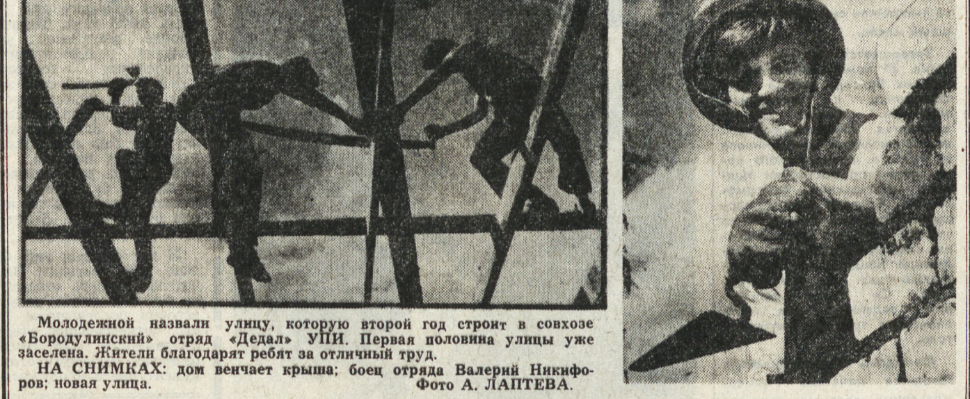
Молодежь назвала улицу, которую второй год строят в совхозе «Бородулинский» отряд «Дедал» УПИ. Первая половина улицы уже заселена. Жители благодарят ребят за отличный труд.

Перед студенческими отрядами, принимающими организациями поставлена задача улучшить работу по вводу в эксплуатацию студенческих объектов, шире развернуть соревнование по достойной встрече XXVI съезда КПСС.