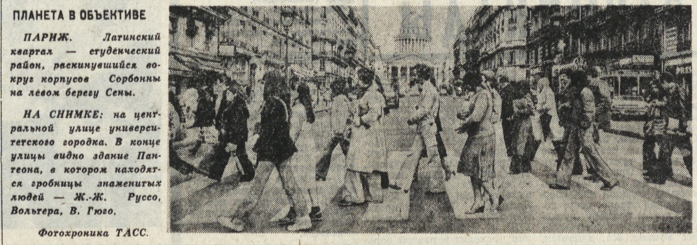
Планета в объективе. Париж, Латинский квартал, раскинувшийся вокруг корпусов Сорбонны на левом берегу Сены.

Мы надеемся, что сотрудничество нашего концерна с СССР будет успешно развиваться и в последующие годы независимо от возникающих трудностей. В настоящее время время от времени политические кризисы и осложнения политической обстановки в мире. Во всяком случае, мы стремимся к этому. Сильный фундамент для сотрудничества ФРГ и СССР заложило подписанное в мае 1978 года во время визита Президента ФРГ в СССР Соглашение о развитии и углублении долгосрочного сотрудничества в интересах всех заинтересованных сторон и на благо мира и сотрудничества. Ибо сегодня нет разумной альтернативы разрядке международной напряженности и мирному решению политических проблем. Политические обязательства и сложная ситуация сегодняшнего дня. Мы знаем, что это трудно, но это необходимо.