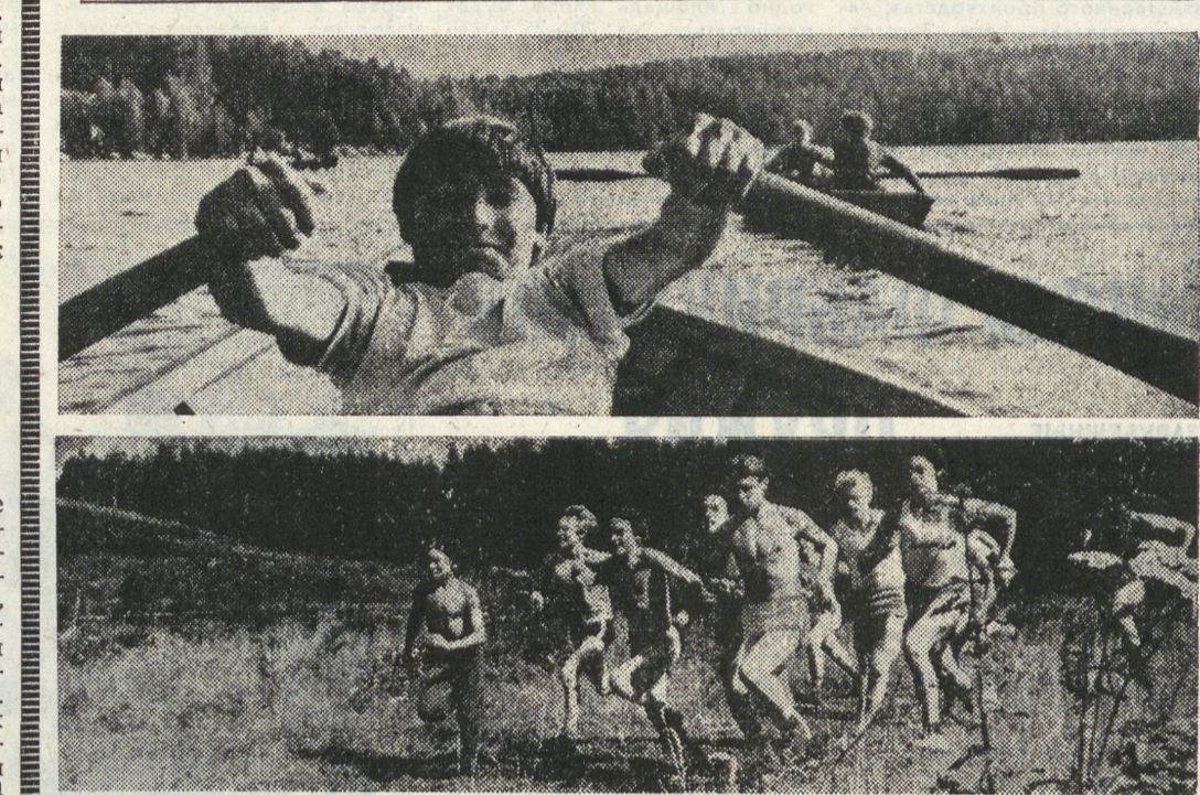
В самом разгаре лето, наполненное многими спортивными событиями. Интереснейшей и крупнейшей из них — Олимпиада — проходит сейчас в Москве и других олимпийских «столицах» нашей страны. К напряженной спортивной борьбе на отлично подготовленных аренах приковано нынче внимание всех болельщиков. Но — «олимпийский год не только для олимпийцев!» — ритми спортивной жизни в коллективах физкультуры утвердился и предпринят, в пионерских лагерях, где сейчас отдыхают юные спортсмены — как всегда, напряжен. НА СНИМКАХ: в жаркий летний день хорошо на реке; идет тренировка.