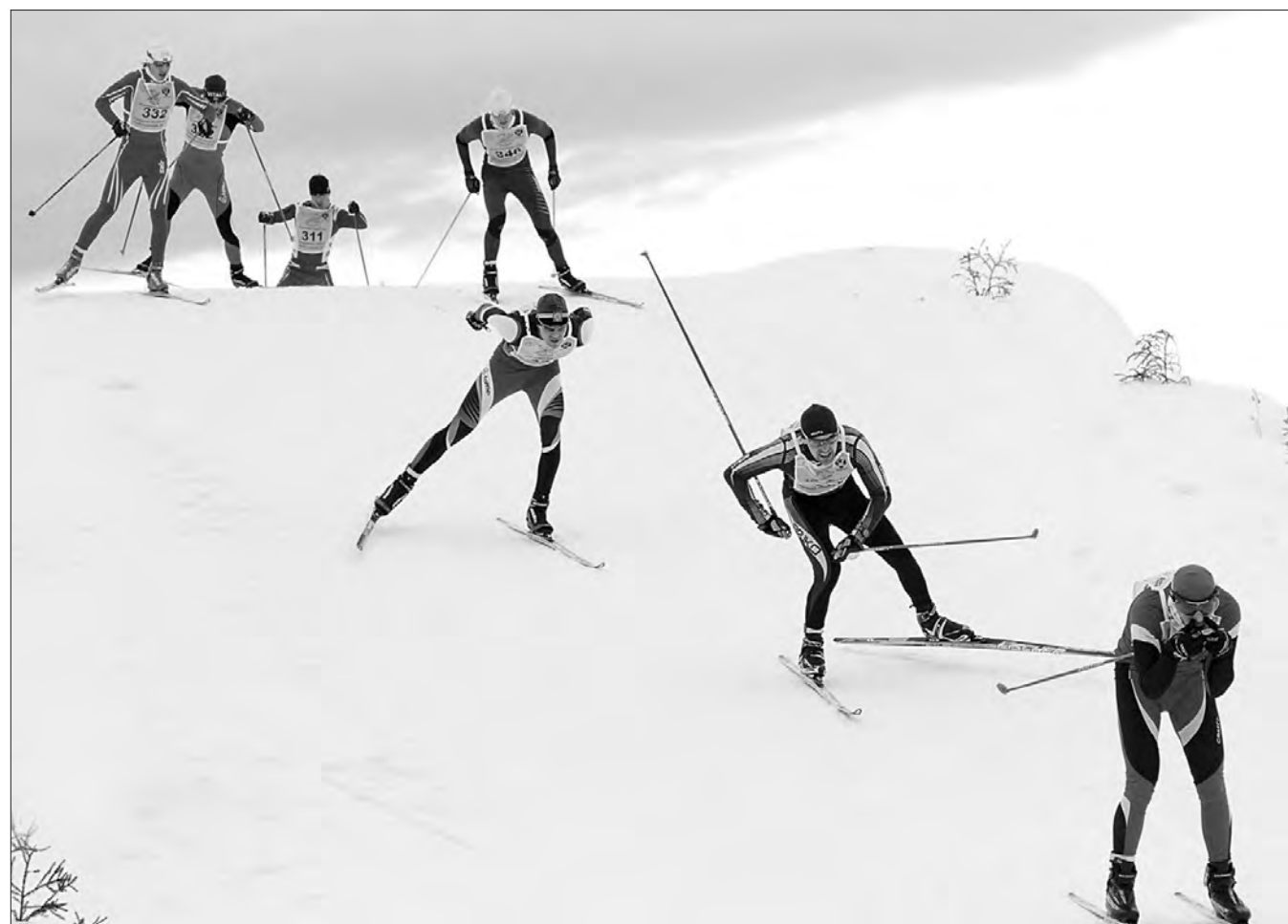
Идет мужская гонка.