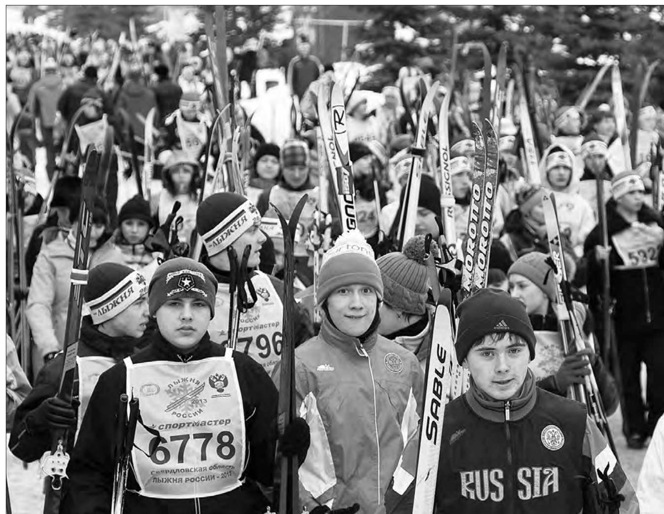
Участники массового забега.