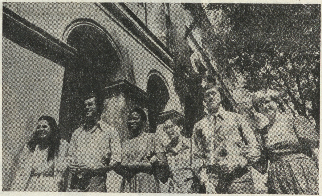
МОСКВА. Московскому государственному педагогическому институту имени Мориса Тореза — 50 лет. Полезна назидать пришли в его аудиторию первые студенты. Сегодня институт — один из крупнейших гуманитарных вузов страны, базовый вуз по подготовке специалистов для школ и вузов, народного хозяйства страны, государственных учреждений, а также различных международных организаций. Сейчас в институте на дневном, вечернем и заочном отделениях, различных курсах обучаются около пяти тысяч человек. Вместе с советскими юношами и девушками здесь учатся студенты и аспиранты из 55 стран мира.