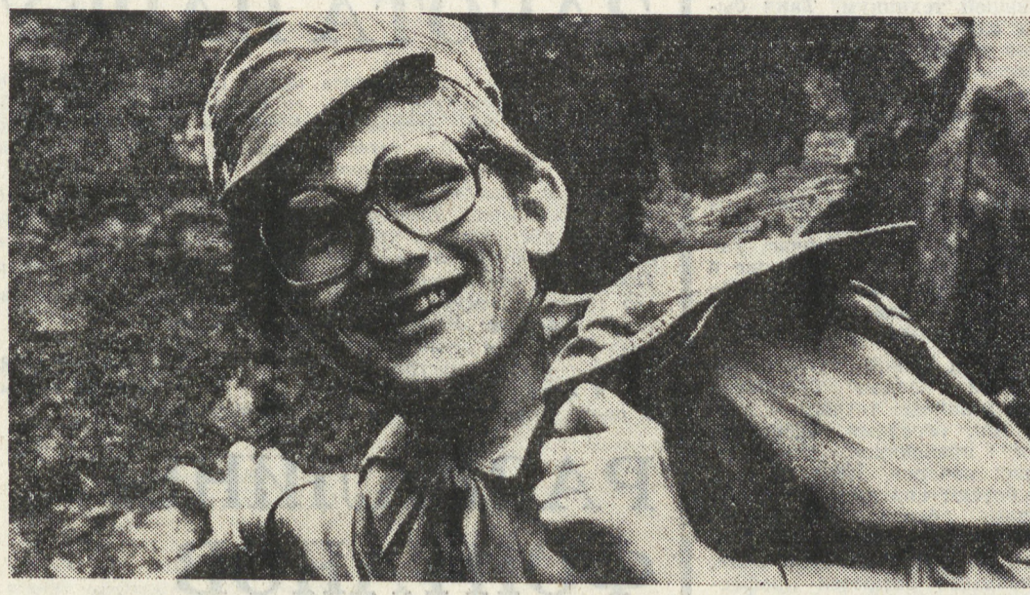
◆ ОПЕРАЦИЯ «ЛЕТО»

ОРГАН СВЕРДЛОВСКОГО ОБКОМА ВЛКСМ ГАЗЕТА ОСНОВАНА 18 ИЮНЯ 1920 ГОДА № 140 (11279) ВТОРНИК, 22 ИЮЛЯ 1980 Г. ВЫХОДИТ ЕЖЕДНЕВНО, КРОМЕ ВОСКРЕСЕНЬЯ И ПОНЕДЕЛЬНИКА Цена 2 коп.