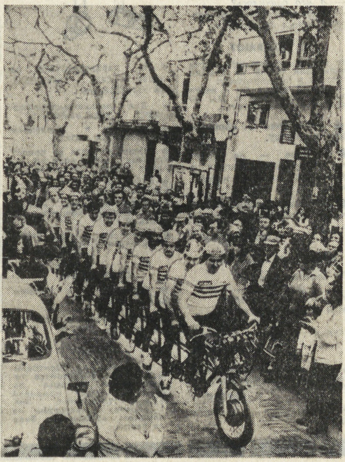
Своеобразный велосипедный фестиваль проводится ежегодно на севере Испании. В нынешнем году в празднике приняло участие более двух тысяч велосипедистов.