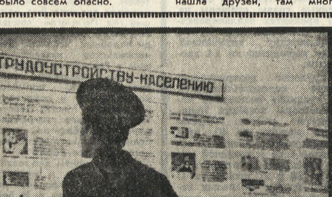
Что выбрать? Куда пойти? Сотни возможностей и вариантов. Надо выбрать один. И выбрать так, чтобы через несколько месяцев не разочароваться и не писать новое заявление: «Прошу уволить...» Такой вопрос стоит сейчас и перед этим демобилизованным воином. Есть над чем задуматься.

— Не надо фамилий. Все равно ничего не изменится, а нас потом заматают. Не верят. Жаль. И Надя нет.