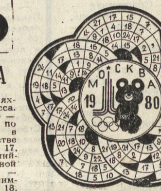
Назовите авторов и названия песен. Составил Г. БЛОХИН. Казанкар.