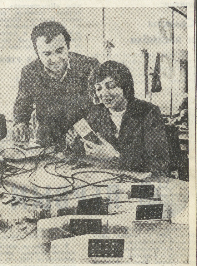
БОЛГАРИЯ. Серийный выпуск электронного телефонного аппарата «ТА-1300» освоил коллектив завода телефонноэлектронной аппаратуры в городе Белоградчик Видицкого округа. Новая модель копочного аппарата обладает рядом преимуществ, в том числе оперативной памятью. К концу нынешнего года предполагается освоить производство еще 26 новых видов телефонных аппаратов. Около 80 процентов продукции предприятия экспортируется в СССР и другие страны — члены СЭВ.