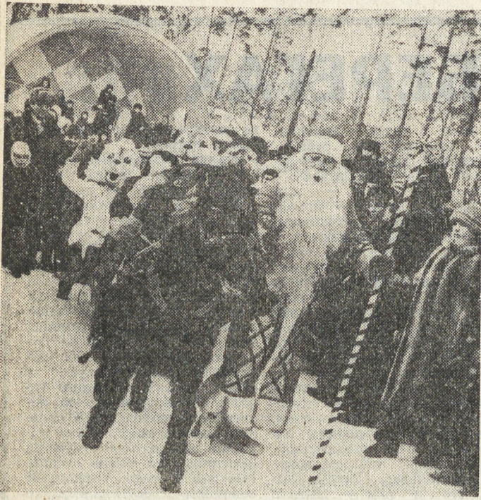
Минувшее воскресенье выдалось как по заказу: с утра на небе сыло солнышко, морозец лаский, не злой. В такие дни в Центральном парке культуры и отдыха Свердловска особо приглашать не нужно: с раннего утра тысячи горожан направляются сюда.

Дорогих гостей всех возрастов встречает Дед Мороз. Игры и аттракционы на снегу, веселые конкурсы, даже концерты, которыми не помеха зимнее время, массовые катания на лыжах и финских санях — на любой вкус развлечения! Аллея парка среди сосен и елочек нарядно украшена, чай из самовара с горячим пирожком придаст бодрости — словом, праздник и для малышей, и для взрослых.