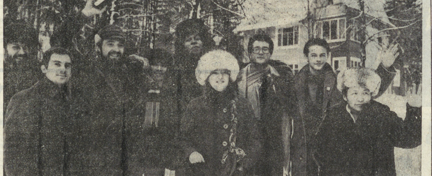
МОСКВА. Союз художников СССР уделяет большое внимание работе с молодыми художниками. Большая группа молодых художников работает сейчас в Доме творчества «Сенеж», расположенном в живописном месте Подмосковья. Борьба за мир — главная тема творчества живописцев и графиков, приехавших из союзных республик, а также молодых художников из разных стран мира. Многие из них готовят работы к предстоящему XII Всемирному фестивалю молодежи и студентов.

Мы провели торжественное заседание КИДА, посвятив его памяти братьев республики. Показали эстонским ребятам, как мы умеем танцевать их танцы, а после — обмен опытом работы. Быстро пролетел этот такой радостный день. Расстались друзья, но остались дружба и память. С. ЖЕРЕБИЛОВА, Красноуральск.