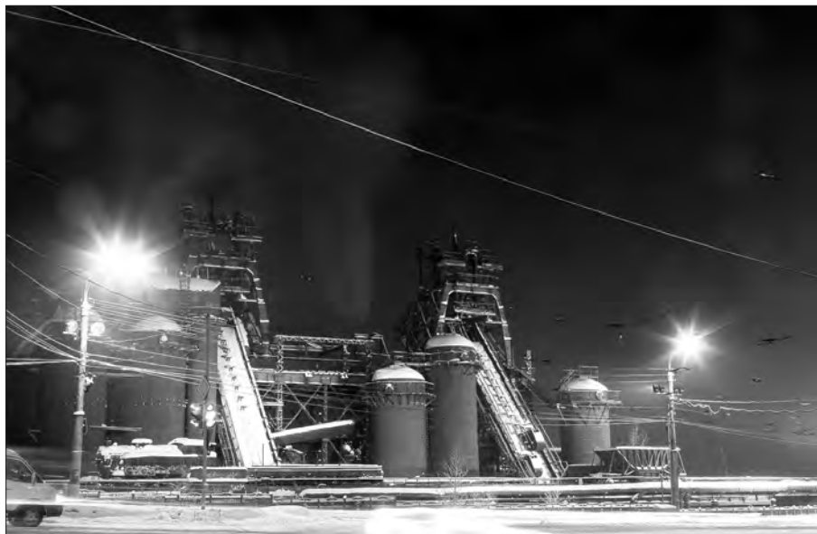
Модернизация освещения прошла на заводе им. Куйбышева.