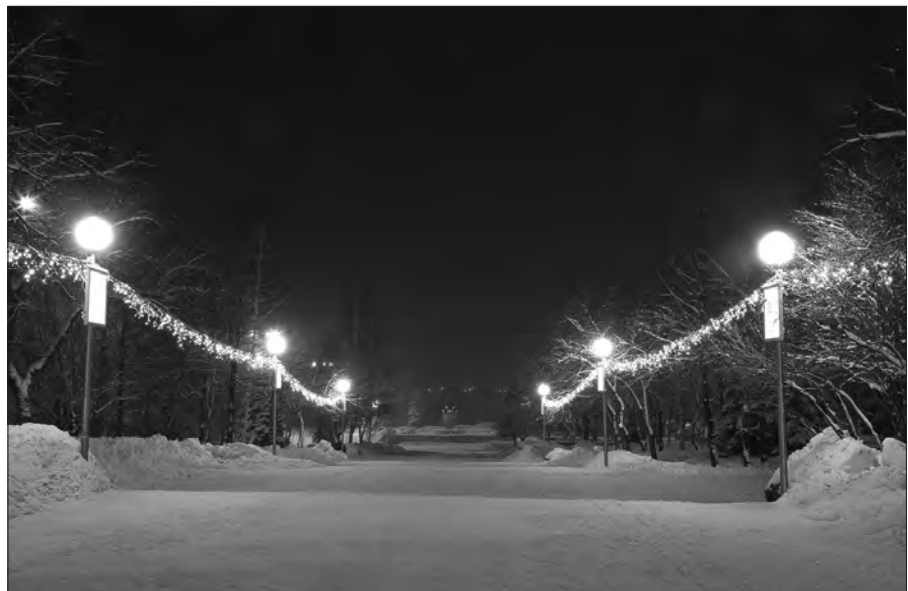
В театральном сквере установили светодиодные светильники на столбах уличного освещения, повесили гирлянды.