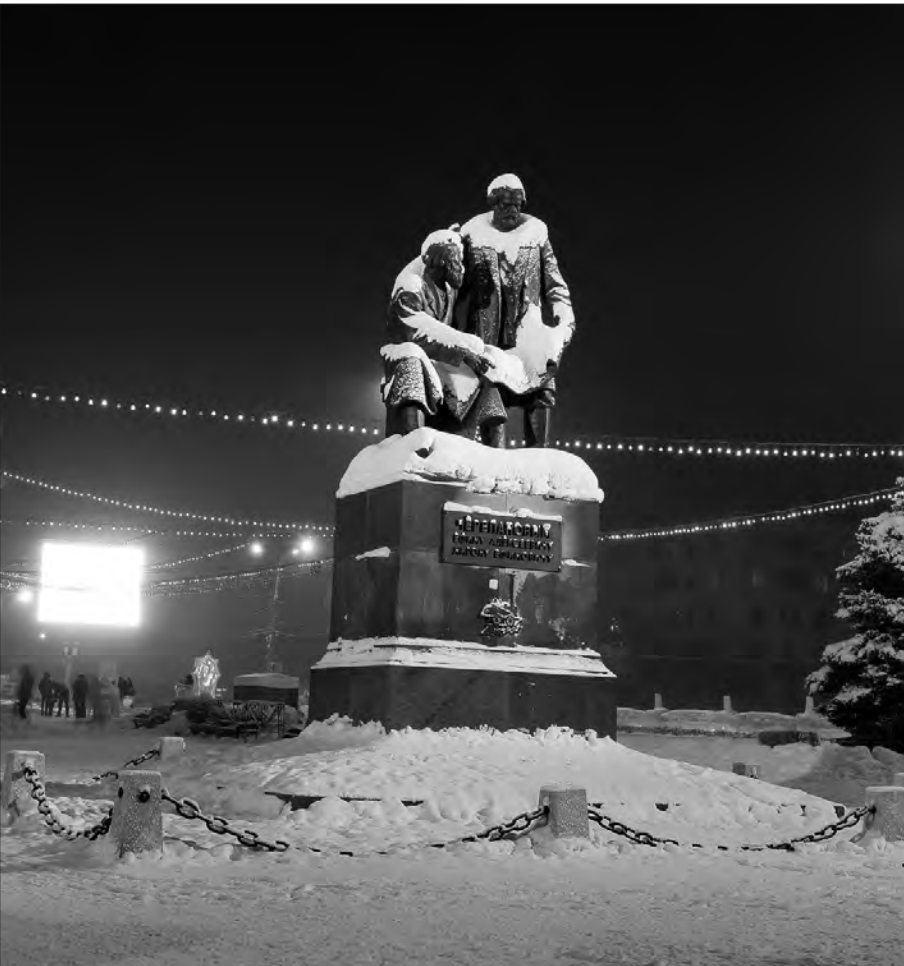
На Театральной площади подсветили памятник Черепановым.

- Спасибо за беседу. Владимир ПАХОМЕНКО.