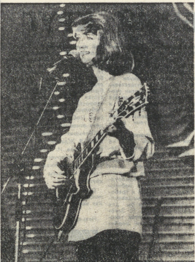
Престиж болгарской эстрады превышает все ожидания.

НА ВЕРХЕМ СНИМКЕ: популярная болгарская эстрадная певица Росица Кириллова.