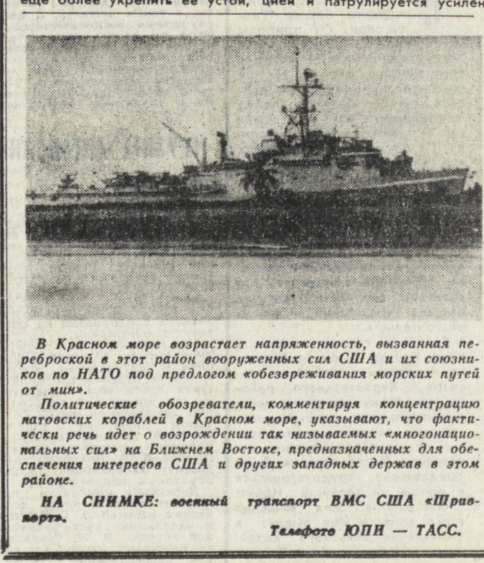
НА СНИМКЕ: военный транспорт ВМС США «Праваерта»...