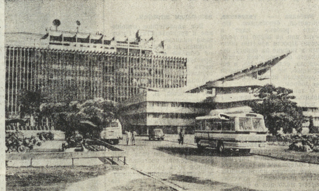
Индийский технологический институт в Дели — одно из крупнейших учебных и научно-исследовательских учреждений страны...

Сейчас в стране насчитываются десятки крупных научно-исследовательских центров. За последние три десятилетия ежегодные ассигнования государства на расширение научных исследований увеличились в 15 раз.