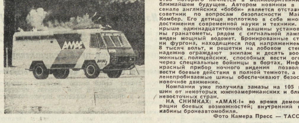
НА СНИМКАХ: «АМАК-1» во время демонстрации боевых возможностей; внутренний вид кабин броневозомобиля.

АНКАРА. По данным государственной организации планирования Турции, уровень безработицы в стране возрос в 1984 году на 6 процентов по сравнению с 1979 годом, составив почти 20 процентов трудоспособного населения. Сообщая об этом, «Мицли газете» констатирует, что для обеспечения рабочих мест около 4 миллионов «лишних людей» необходимо затратить сумму, в шесть